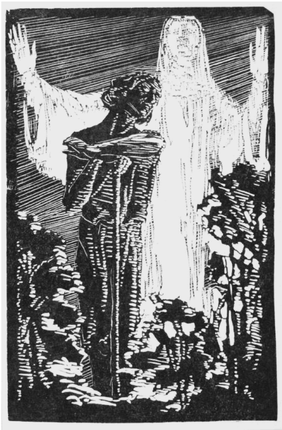
František Bílek: Jsem zahradník tvých zahrad